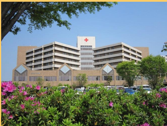
今回活動をした 熊本日赤病院