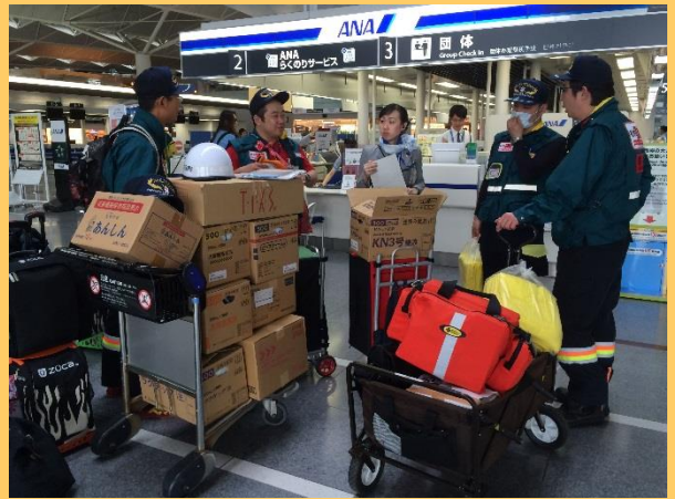
セントレアでの搭乗 たくさんの荷物です。