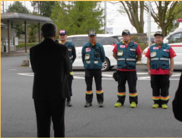
出発式の様子 青山市長から 激励をいただきました。

4月18日から21日まで熊本日赤病院において病院支援を行いました。下の写真はそのときの様子です。